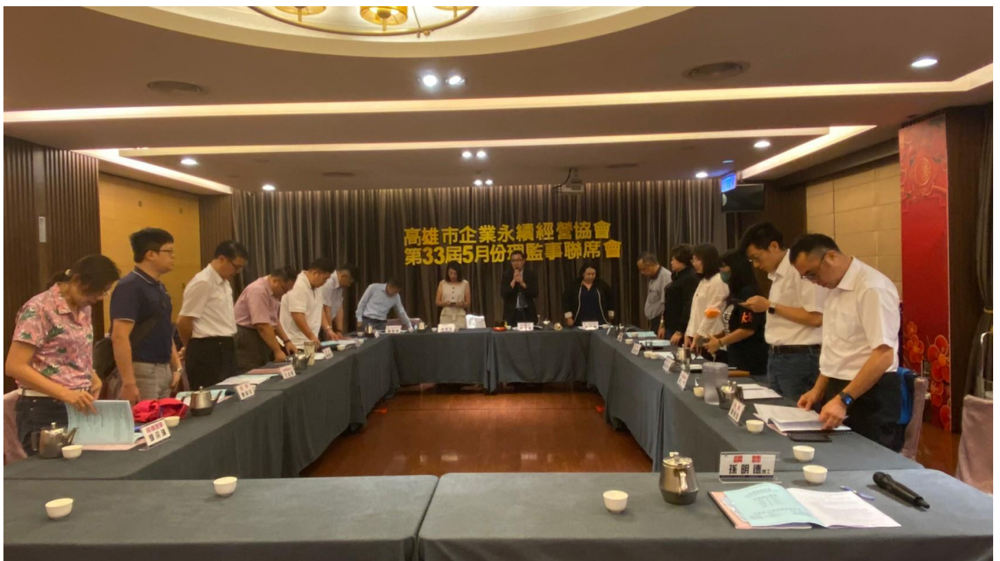
112/05/02 理監事聯席會議 朗讀協會宗旨